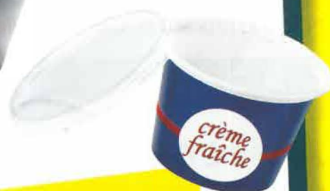
TOUS LES POTS ET BOITES EN PLASTIQUE