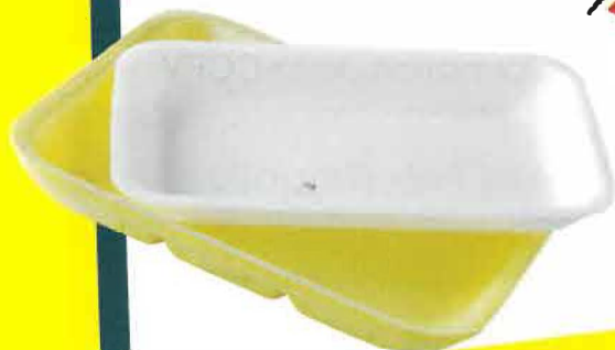
TOUTES LES BARQUETTES EN PLASTIQUE ET POLYSTYRENE

Bac de tri : Bac à couvercle jaune ou autre bac identifié avec une étiquette jaune.