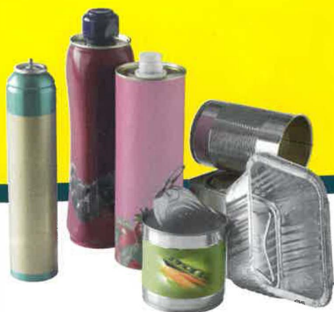
Canettes, Barquettes alus Conserves, Aérosols