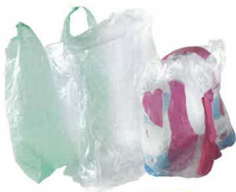
TOUS LES FILMS, BLISTERS, SACS ET SACHETS EN PLASTIQUE