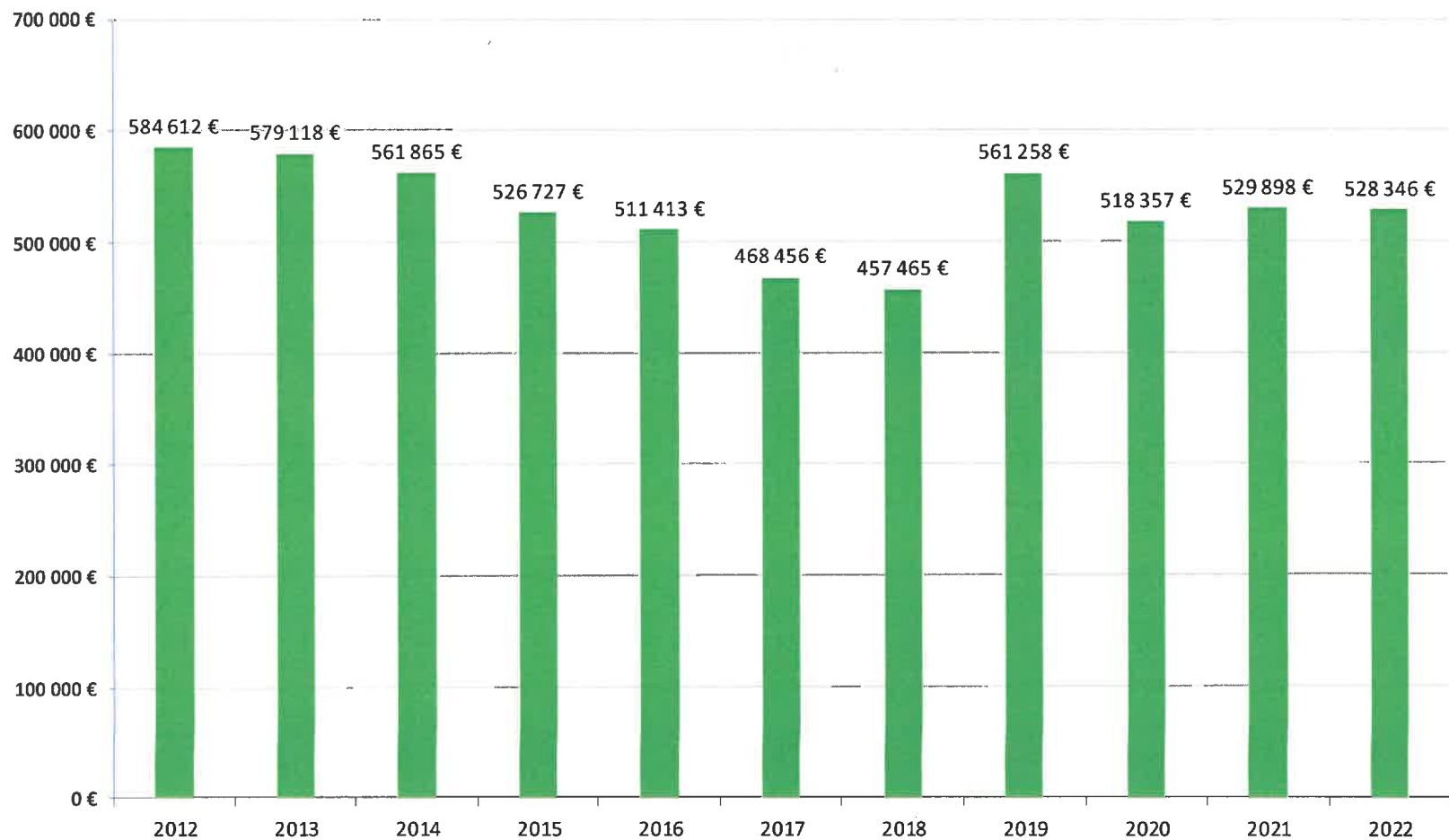
Evolution des dotations de l'Etat